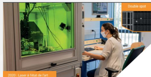
2020 : Laser à l'état de l'art